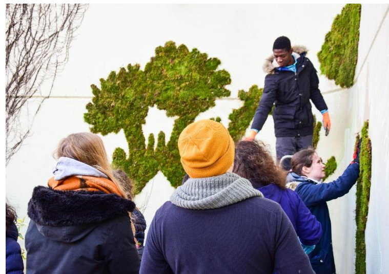
Réalisation de la fresque végétale « Silence, ça mousse »