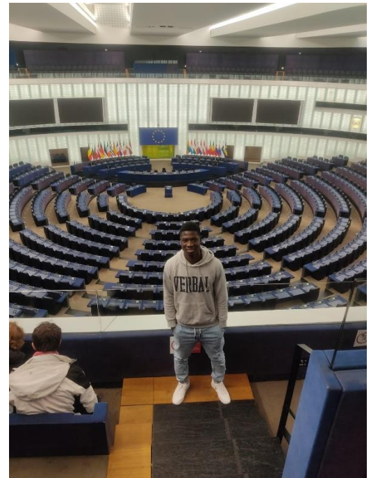
Visite du parlement européen