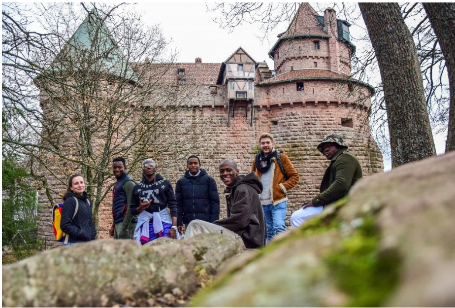
Visite du Haut-Koenigsbourg