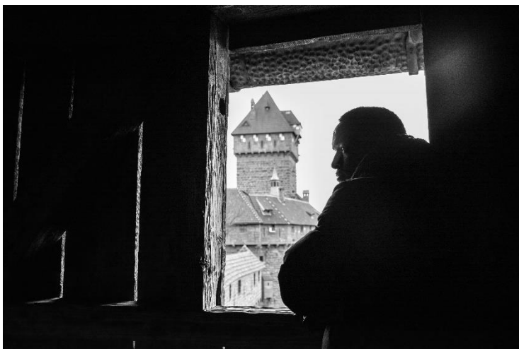
Visite du Haut-Koenigsbourg