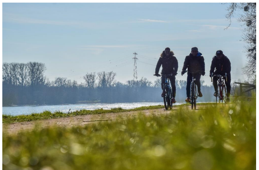
Balade à vélo au bord du Rhin